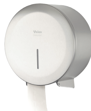
VEIRO JUMBO STEEL

Широко применяется в местах общественной гигиены с высокой и средней проходимостью в Офисных и Административных зданиях, заведениях сегмента HoReCa, Медицинских учреждениях, на объектах Транспорта, Спортивных объектах.